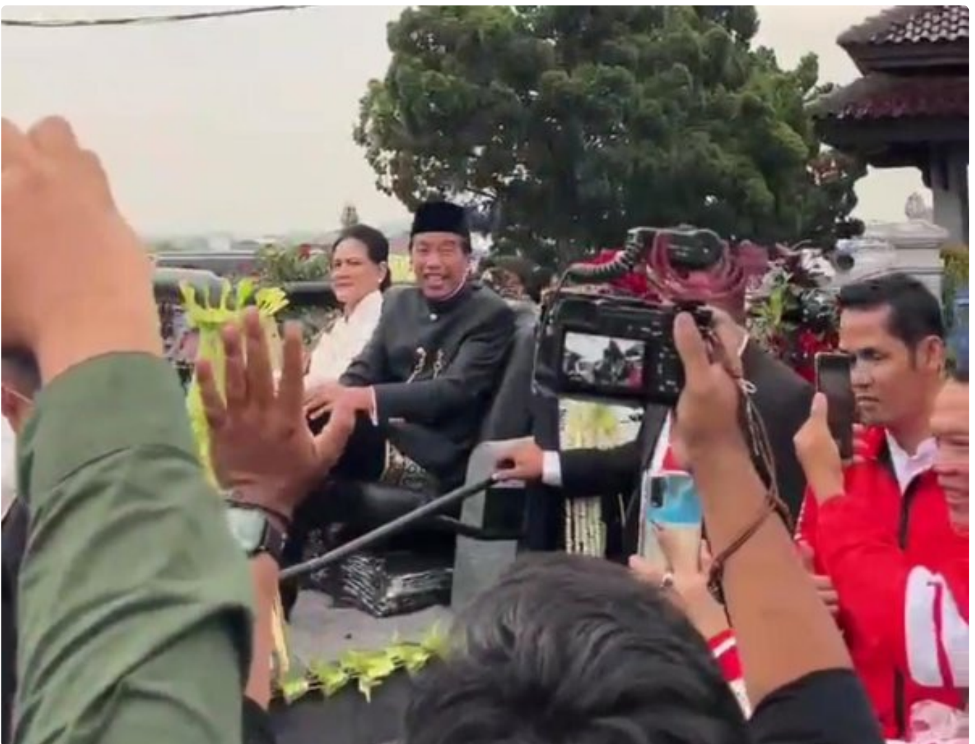
Foto: Antusiasme warga Solo memuncak saat mantan Presiden RI ke-7, Ir. H. Joko Widodo, kembali ke tanah kelahirannya pada Minggu, 20 Oktober 2024.

SURAKARTA- Antusiasme warga Solo memuncak saat mantan Presiden RI ke-7, Ir. H. Joko Widodo, kembali ke tanah kelahirannya pada Minggu, 20 Oktober